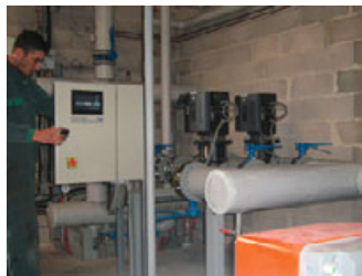
Maintenance de la chaufferie

L'énergie est distribuée par des canalisations d'eau chaude pré-isolées.