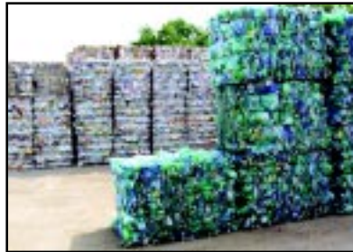
Stockage avant l'expédition.