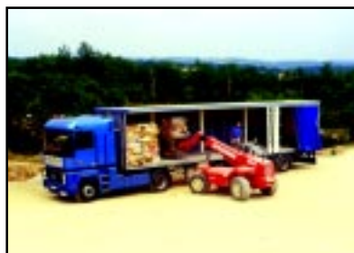
Expédition vers les usines de recyclage.

Ces usines peuvent changer selon les contrats Eco-Emballages.