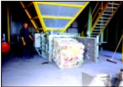
Conditionnement en balle.

Afin de favoriser l'emploi, le SY.D.E.D. a pris le parti de peu mécaniser le tri. Dans la salle de tri, les déchets sont triés manuellement par matière (pet, pehd, films plastiques, carton, briques, papier, acier, aluminium).