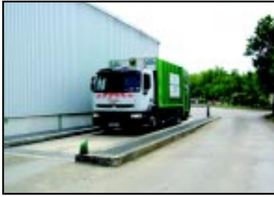
Pesée du camion à son arrivée.