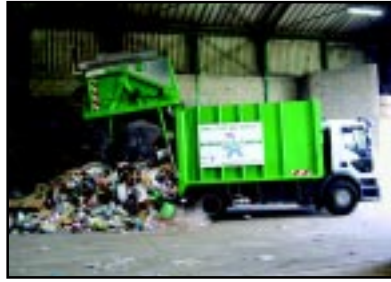
Vidage dans le hall de stockage.