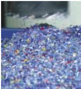
Bouteilles plastiques broyées pour être recyclées

Tous les experts sont désormais d'accord : notre planète est en danger. C'est la conclusion à laquelle aboutissent les médias qui depuis plusieurs semaines s'expriment sur l'état de l'écosystème terrestre.