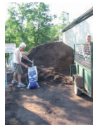
...à la prise de compost

Le compost est soumis régulièrement à des analyses effectuées par un laboratoire indépendant. Les résultats sont affichés sur chaque site.