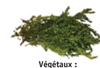
Végétaux : tonte de pelouse, feuilles, élagages d'arbres...