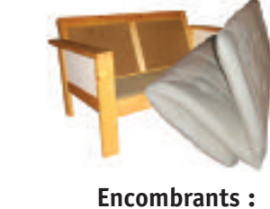
Encombrants : matelas, meubles...