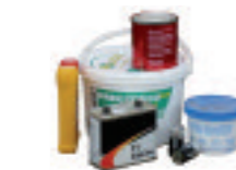
Déchets toxiques : piles, peintures, solvants...