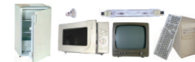
Déchets d'Équipement Électriques et Electroniques (DEEE)