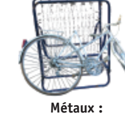
Métaux : ferreux et non ferreux