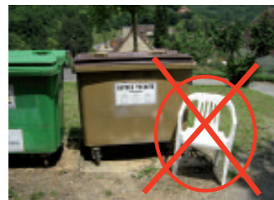
Il est interdit de déposer des encombrants à côté des conteneurs