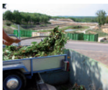
du dépôt de végétaux...

Les végétaux récupérés sur les déchetteries sont acheminés sur les 3 plateformes de compostage du SY.D.E.D. Le compost obtenu est ensuite mis gratuitement à la disposition des usagers, en vrac, sur la plupart des déchetteries (exceptées celles de Cahors et Gourdon), dans la limite de 3 m 3 par foyer et par an.