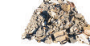
Gravats : démolition, briques, tuiles...