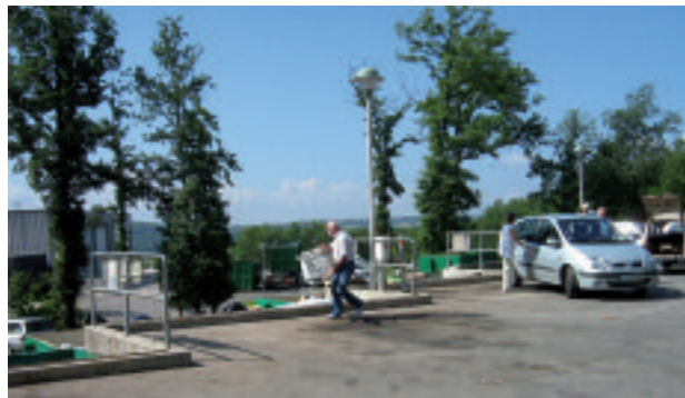
Déchetterie de Figeac

La création de ces équipements a permis la disparition progressive d'un bon nombre de décharges sauvages, qui défiguraient, il y a quelques années encore, notre environnement.