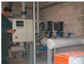
Maintenance de la chaufferie

L'alimentation est assurée par un extracteur à échelle couplé à une chaîne transporteuse. Le décendrage est réalisé par vis sans fin. L'énergie est distribuée par des canalisations d'eau chaude pré-isolées.